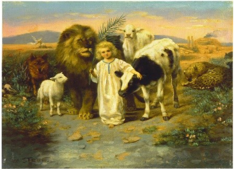
“Jesaja’s vrede” van William Strutt (1825-1915)

In veel gevallen is duidelijk op wat een bepaalde fase slaat, in andere gevallen is het aan interpretatie onderhevig. Zie bij het onderdeel Gestructureerd lezen voor aanduidingen van de fasen.